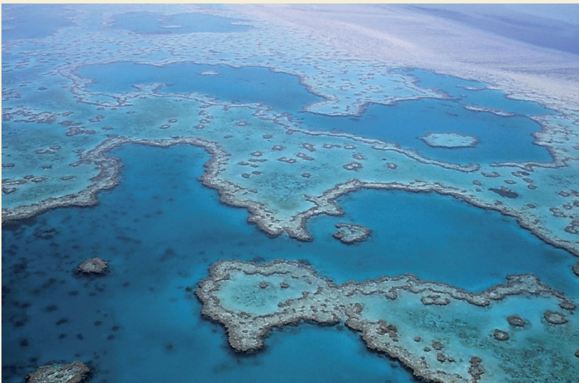
Gran Barrera de Coral en Australia.

Davis, K. L. et al. (2021), “Global coral reef ecosystems exhibit declining calcification and increasing primary productivity”, Communications Earth & Environment , 2:105.