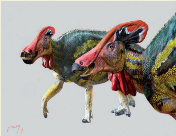
Figura 1. Tlatolophus galorum . Crédito: Luis V. Rey.