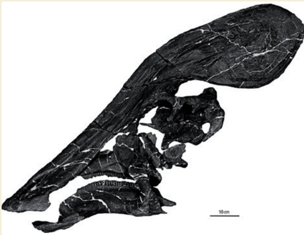
Figura 2. Cráneo del Tlatolophus galorum .